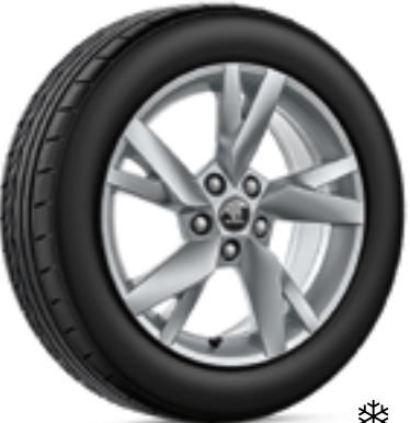
Lyra серебристые металл 6.5J × 17" ET46 для 205/55 R17 5E3 071 497AC 8Z8