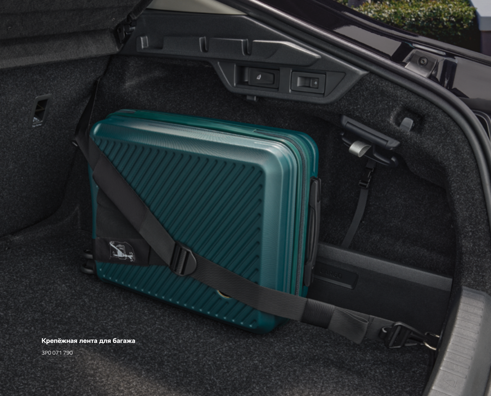
Крепёжная лента для багажа