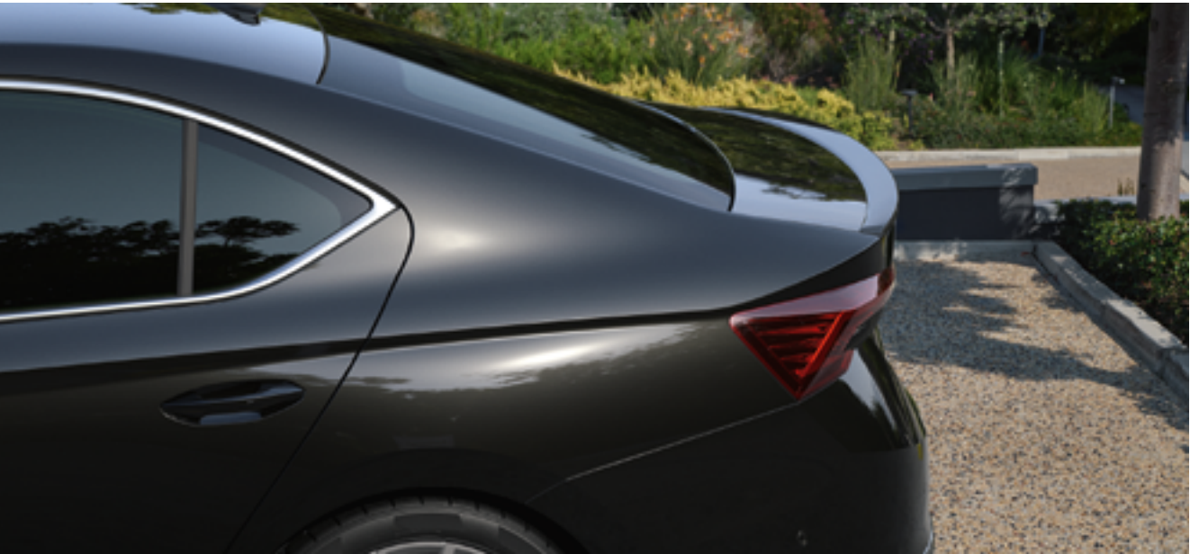
Спойлер заднего бампера