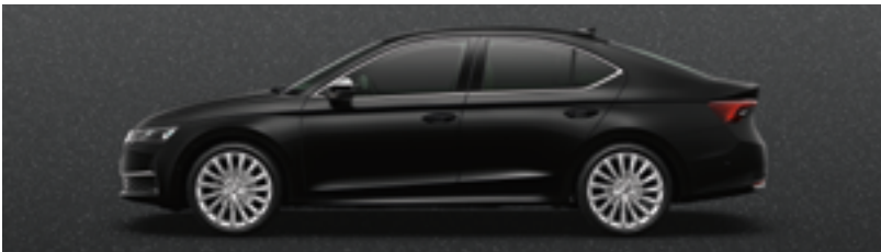
Черный Magic металлик