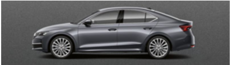
Серый Graphite металлик