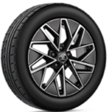
Slagard черные металл, шлифованные 7.0J × 17" ET46 для 205/55 R17 5E3 071 497AG FL8