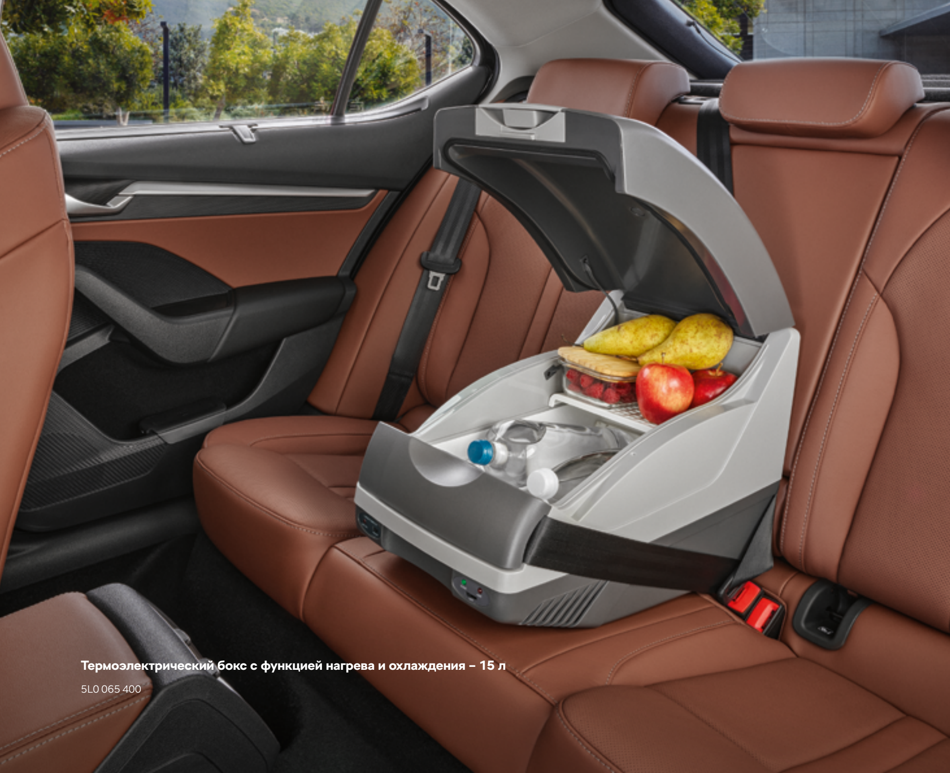
Термоэлектрический бокс с функцией нагрева и охлаждения – 15 л