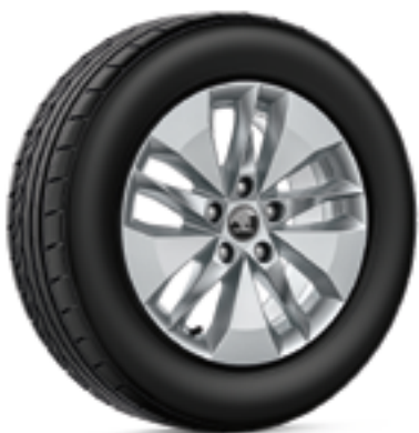
Alasia серебристые металл 7.0J × 16" ET46 для 205/60 R16 5E3 071 496AC 8Z8