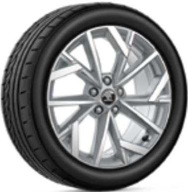
Avior серебристые металлик, шлифованные 7.5J × 18" ET48 для 225/45 R18 5E3 071 498AN 8Z8