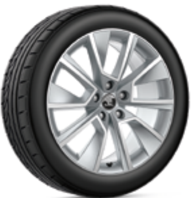
Braga серебристые металлик 7.5J × 18" ET48 для 225/45 R18 5E3 071 498AA 8Z8