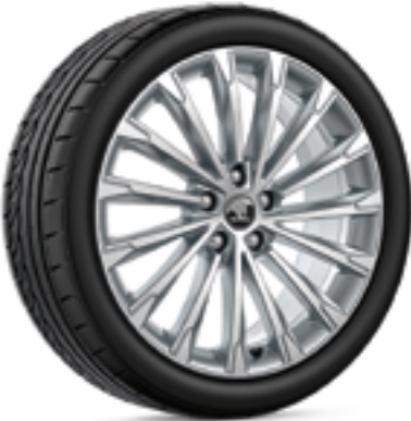
Becrux серебристые металлик, шлифованные 7.5J × 19" ET48 для 225/40 R19 5E3 071 499AD 8Z8