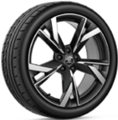
Draconis черные металлик, шлифованные 7.5J × 19" ET48 для 225/40 R19 5E3 071 499AJ FL8