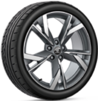
Draconis антрацит металлик, шлифованные 7.5J × 19" ET48 для 225/40 R19 5E3 071 499AK HA7