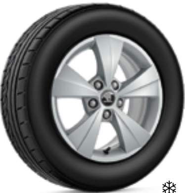
Velorum серебристые металл 6.5J × 16" ET46 для 205/60 R16 5E3 071 496AA 8Z8