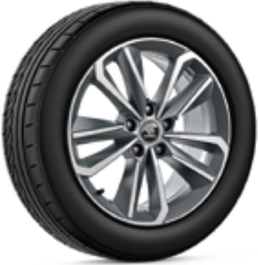
Aries антрацит металл, шлифованные 7J × 17" ET46 для 205/55 R17 5E3 071 497AF HA7