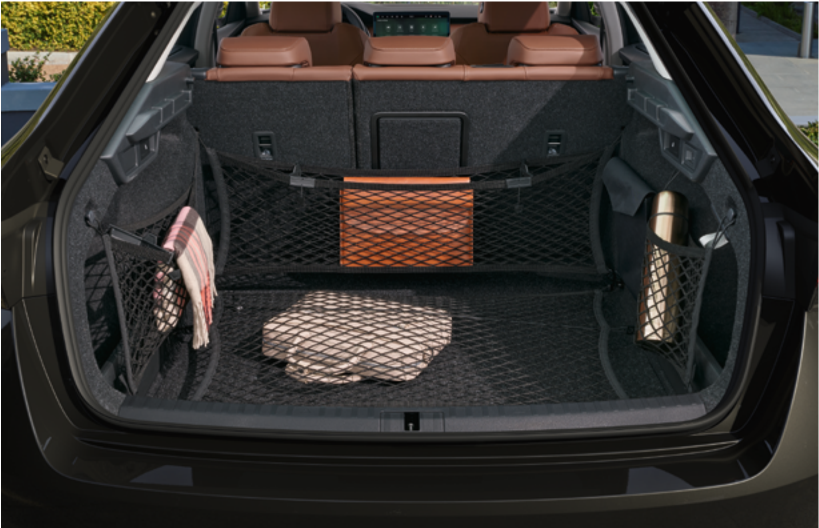
Сетчатый органайзер для Combi

5E6 061 162C | Limo 5E7 061 162C | Combi