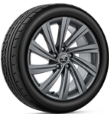
Perseus антрацит металлик 7.5J × 18" ET48 для 225/45 R18 5E3 071 498AM HA7