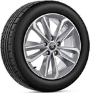
Aries серебристые металл, шлифованные 7J × 17" ET46 для 205/55 R17 5E3 071 497AE 8Z8