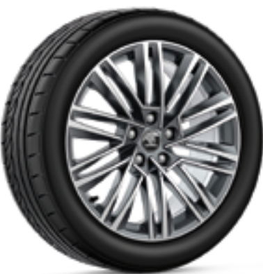
Luxon антрацит металлик, шлифованные 7.5J × 18" ET48 для 225/45 R18 5E3 071 498AH HA7