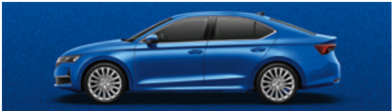
Синий Race металлик