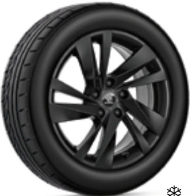
Nevis черные металл 6.5J × 17" ET46 для 205/55 R17 5E3 071 497AB FL8