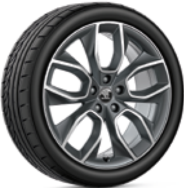
Manaslu антрацит металлик, шлифованные 7.5J × 19" ET48 для 225/40 R19 5E3 071 499AG HA7