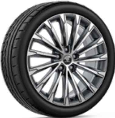
Becrux антрацит металлик, шлифованные 7.5J × 19" ET48 для 225/40 R19 5E3 071 499AE HA7