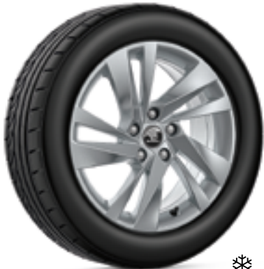
Nevis серебристые металл 6.5J × 17" ET46 для 205/55 R17 5E3 071 497AA 8Z8