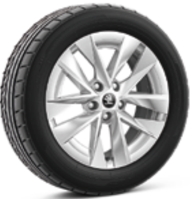
17" легкосплавные диски Rotare Aero, серебристые