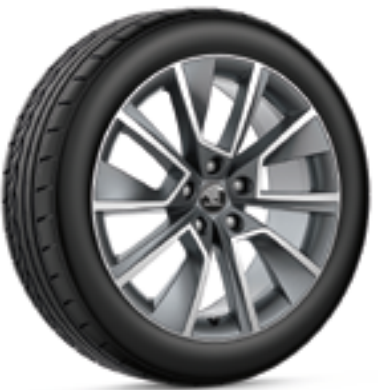
Braga антрацит, шлифованные 7.5J × 18" ET48 для 225/45 R18 5E3 071 498AB HA7