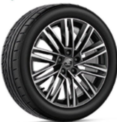
Luxon черные металлик, шлифованные 7.5J × 18" ET48 для 225/45 R18 5E3 071 498AG FL8