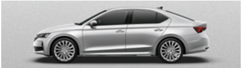
Серебристый Brilliant металлик