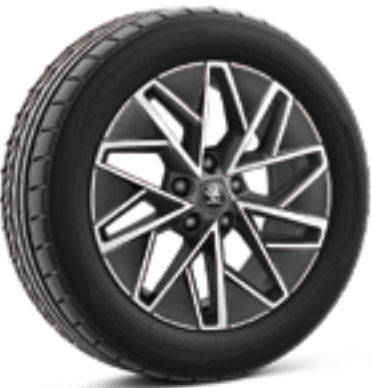
17" легкосплавные диски Slagard Aero, черные металлик