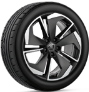
Comet черные металлик, шлифованные 7.5J × 18" ET48 для 225/45 R18 5E3 071 498AE FL8