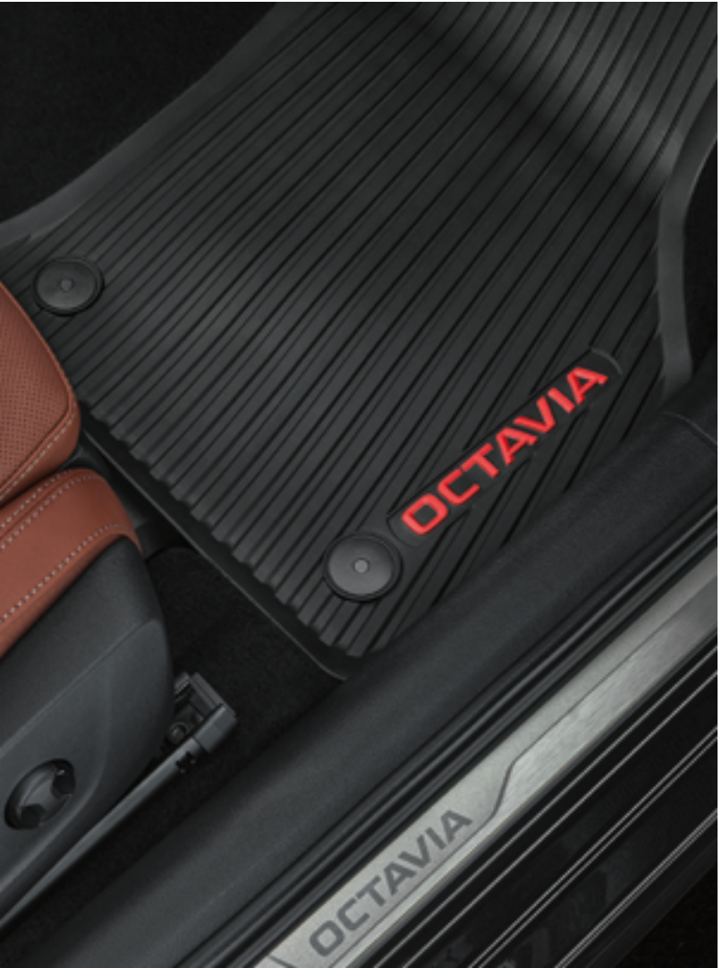
Всесезонные коврики – красные акценты