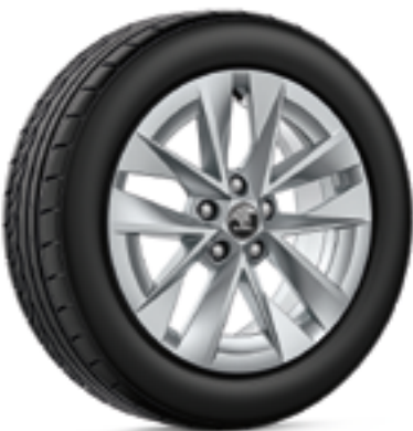
Rotare серебристые металл 7.0J × 17" ET46 для 205/55 R17 5E3 071 497AH 8Z8