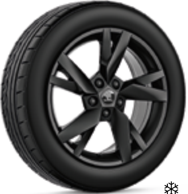
Lyra черные металл 6.5J × 17" ET46 для 205/55 R17 5E3 071 497AD FL8