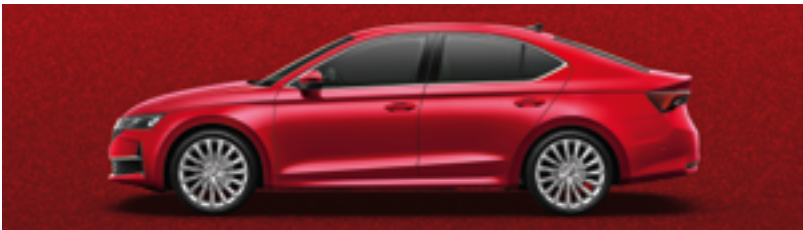
Красный Velvet металлик