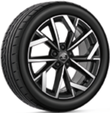
Avior черные металлик, шлифованные 7.5J × 18" ET48 для 225/45 R18 5E3 071 498AP FL8