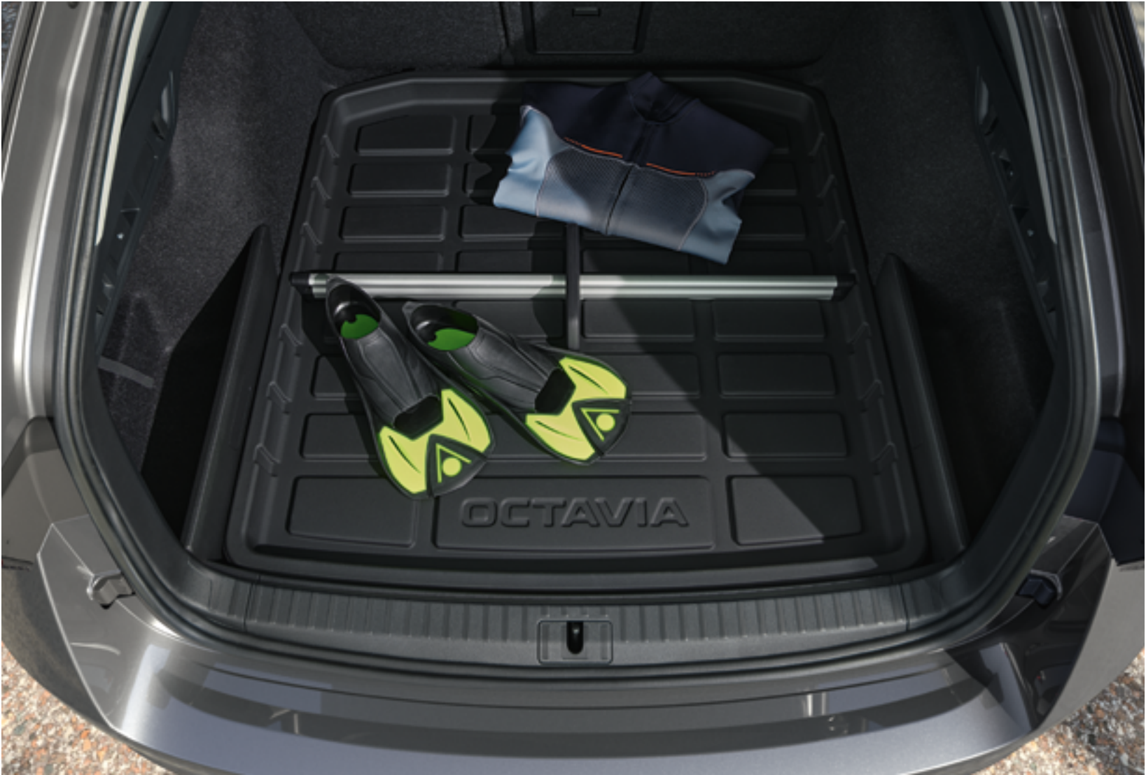
Поддон багажного отделения