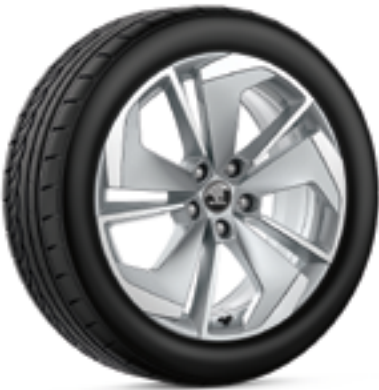
Comet серебристые металлик, шлифованные 7.5J × 18" ET48 для 225/45 R18 5E3 071 498AJ 8Z8