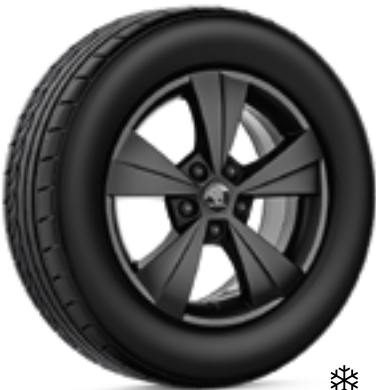
Velorum черные металл 6.5J × 16" ET46 для 205/60 R16 5E3 071 496AB FL8