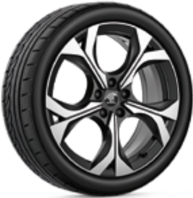
Elias черные металлик, шлифованные 7.5J × 19" ET48 для 225/40 R19 5E3 071 499AF FL8