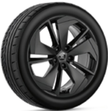
Comet черные металлик 7.5J × 18" ET48 для 225/45 R18 5E3 071 498AF FL8