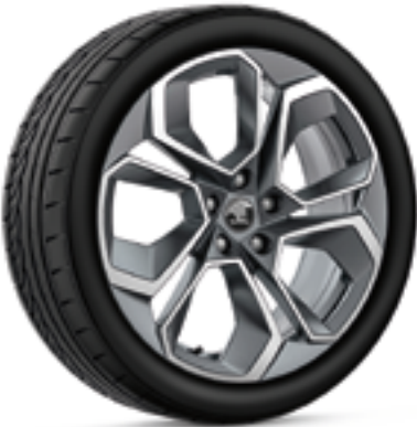
Altair антрацит металлик, шлифованные 7.5J × 19" ET48 для 225/40 R19 5E3 071 499AB HA7