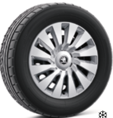
Tekton Колпаки колес для стальных дисков 17" 5E0 071 456C | комплект из 4 штук