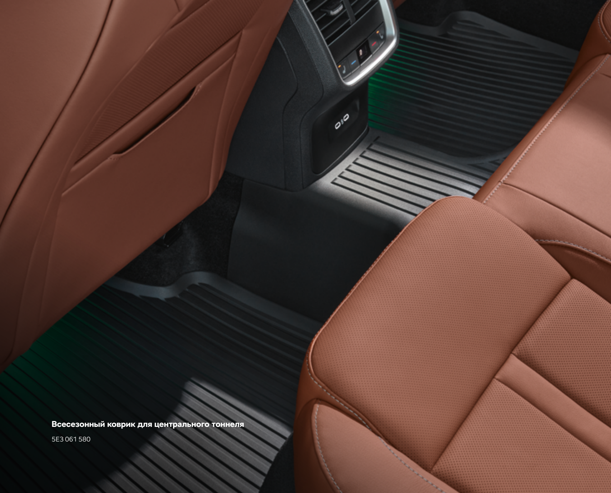
Всесезонный коврик для центрального тоннеля