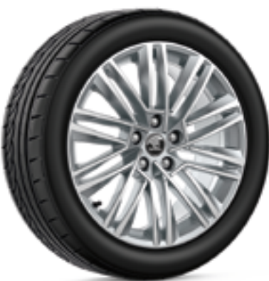
Luxon серебристые металлик, шлифованные 7.5J × 18" ET48 для 225/45 R18 5E3 071 498AF 8Z8