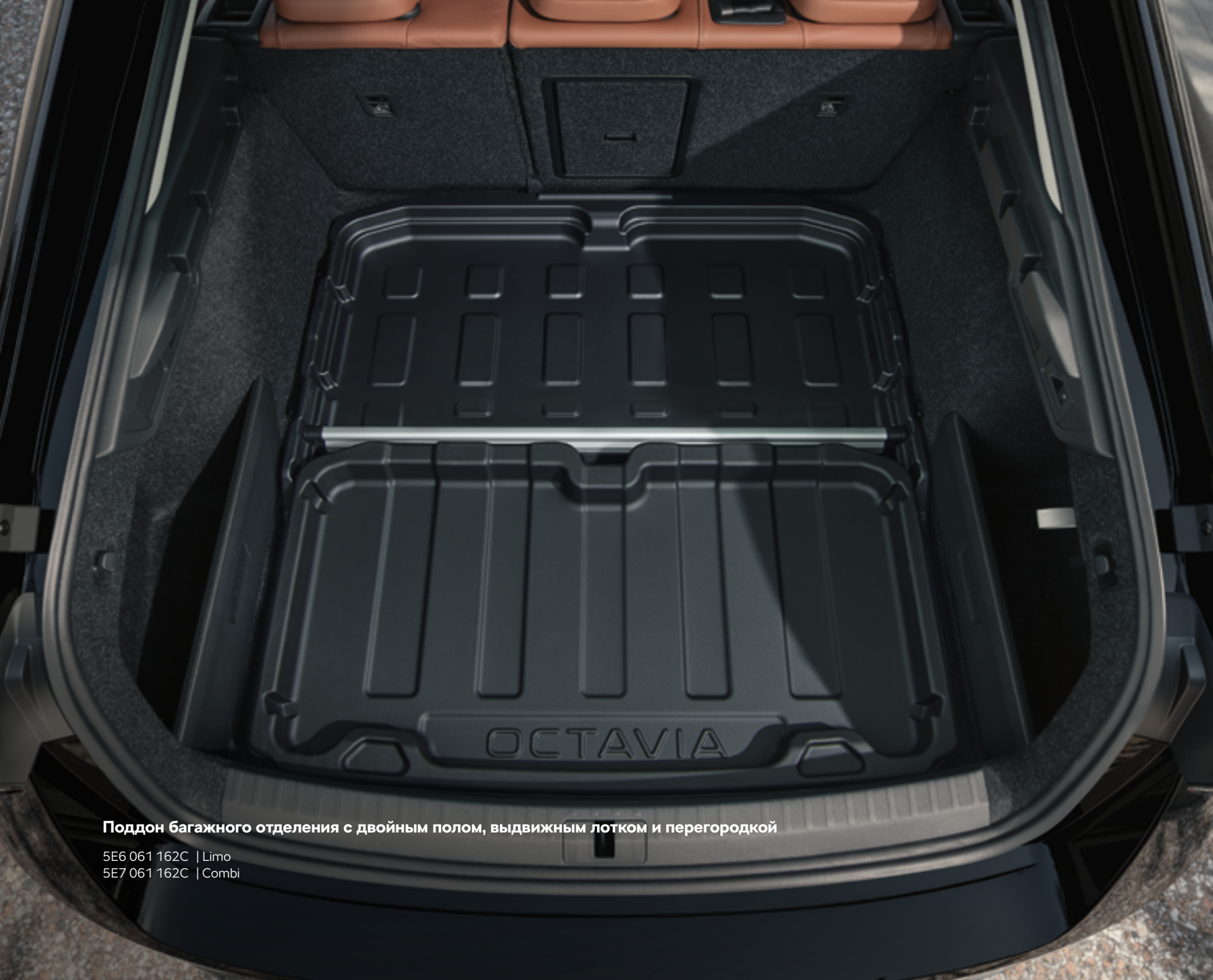
Поддон багажного отделения с двойным полом, выдвижным лотком и перегородкой

5E6 061 162C | Limo 5E7 061 162C | Combi