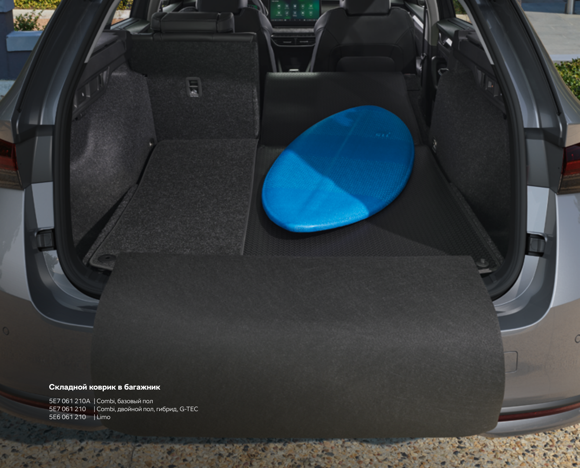
Складной коврик в багажник