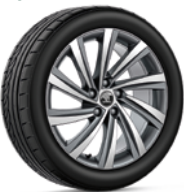
Perseus антрацит металлик, шлифованные 7.5J × 18" ET48 для 225/45 R18 5E3 071 498AL HA7