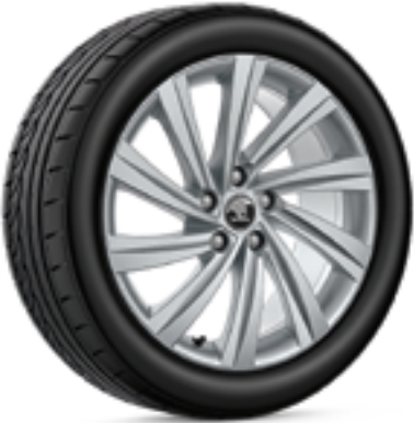
Perseus серебристые металл 7.5J × 18" ET48 для 225/45 R18 5E3 071 498AK 8Z8