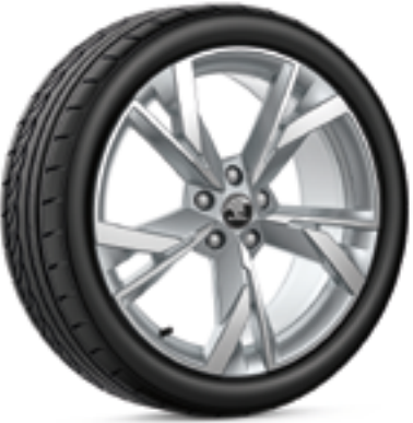
Draconis серебристые металлик, шлифованные 7.5J × 19" ET48 для 225/40 R19 5E3 071 499AN 8Z8