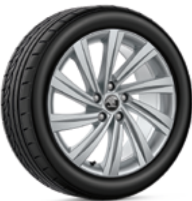
Perseus серебристые металлик, шлифованные 7.5J × 18" ET48 для 225/45 R18 5E3 071 498AJ 8Z8