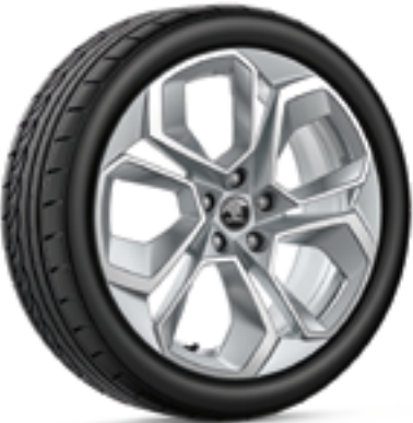
Altair серебристые металлик, шлифованные 7.5J × 19" ET48 для 225/40 R19 5E3 071 499AC 8Z8