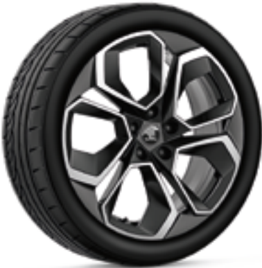
Altair черные металлик, шлифованные 7.5J × 19" ET48 для 225/40 R19 5E3 071 499AA FL8