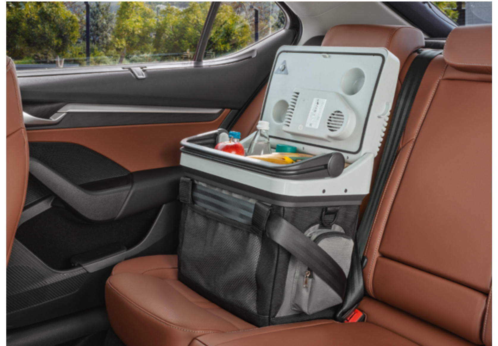
Термоэлектрический бокс для охлаждения – 20 л