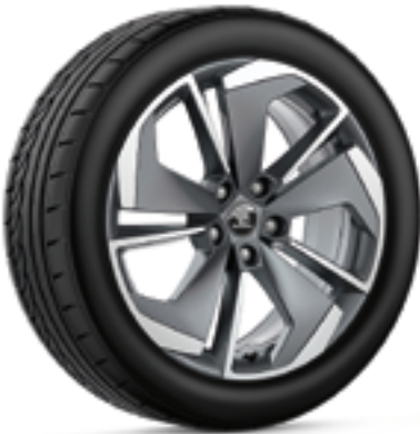
Comet антрацит металлик, шлифованные 7.5J × 18" ET48 для 225/45 R18 5E3 071 498AL HA7