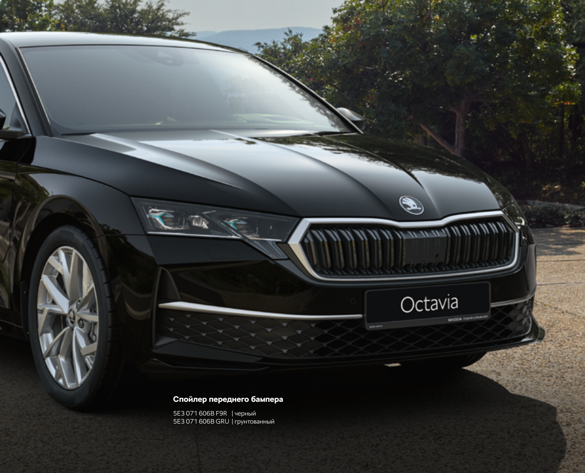
Спойлер переднего бампера

5E3 071 606B F9R | черный 5E3 071 606B GRU | грунтованный