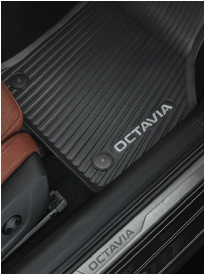
Всесезонные коврики – серые