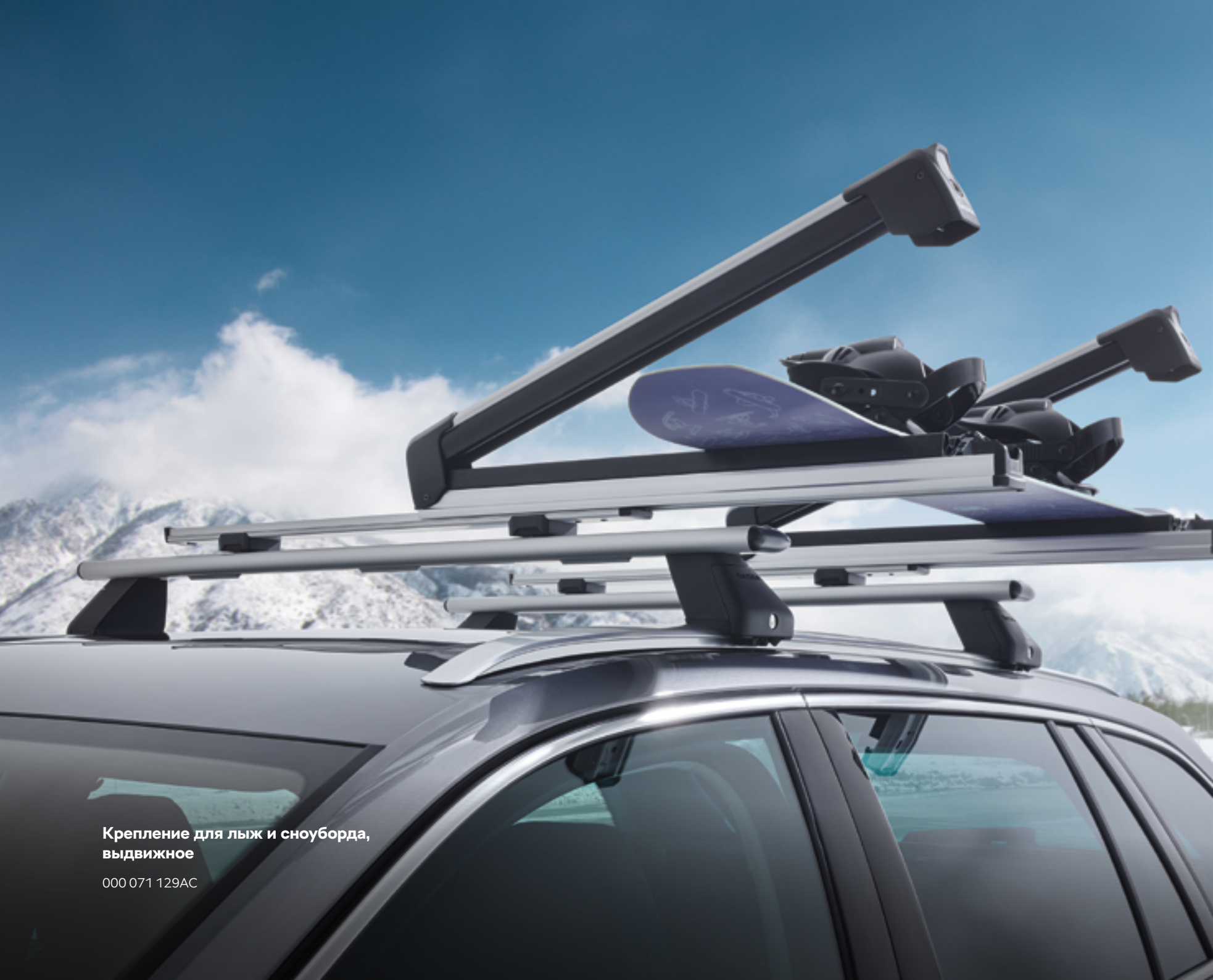
Крепление для лыж и сноуборда, выдвижное