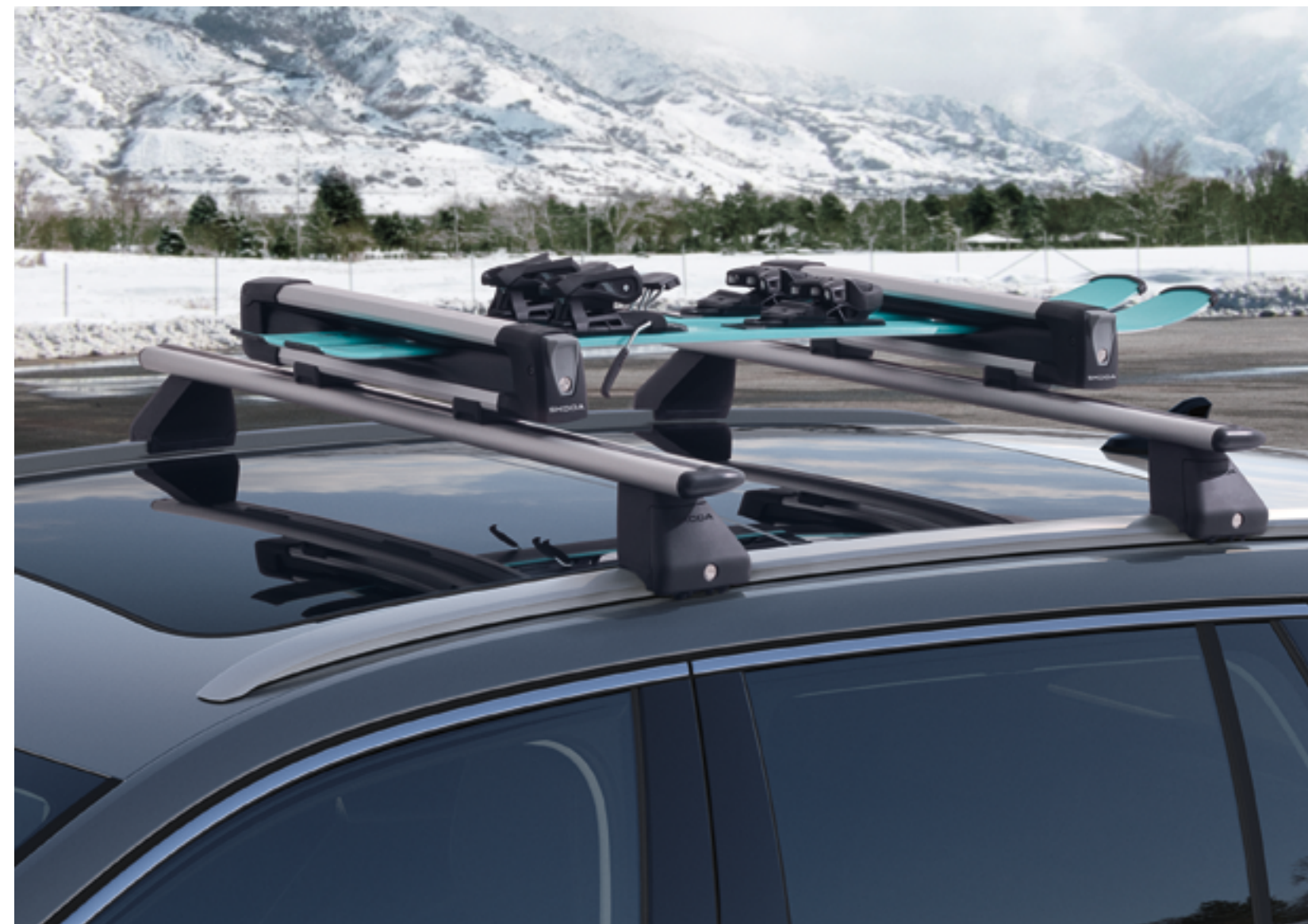
Крепление для лыж и сноуборда